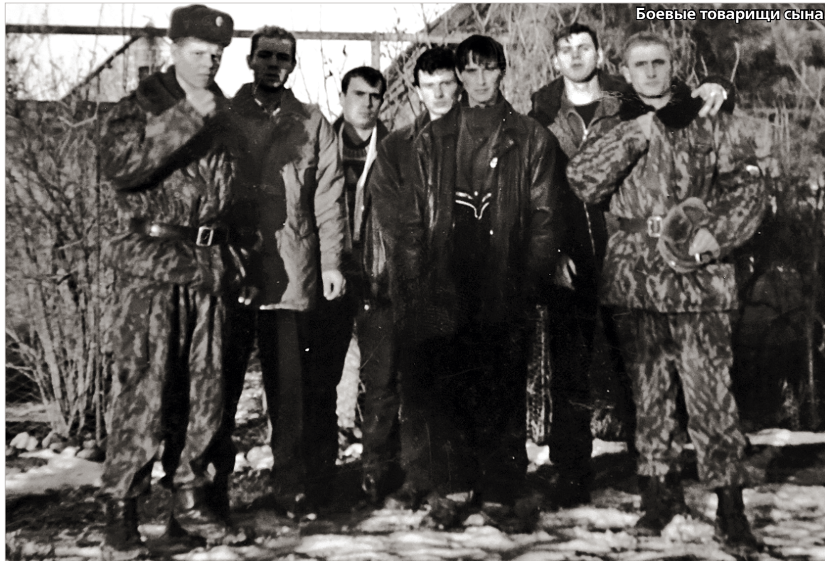
Боевые товарищи сына