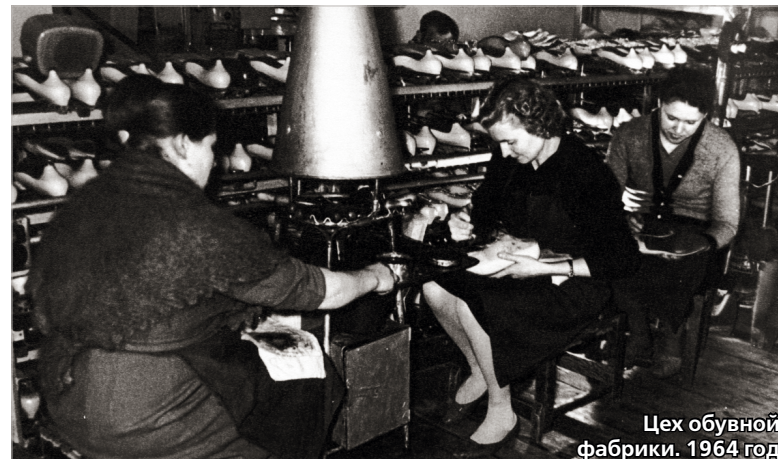
Цех обувной фабрики. 1964 год

Еще одно предприятие, без которого история обувного дела на Ставрополье была бы неполной, это обувная фабрика «Кавказ». В