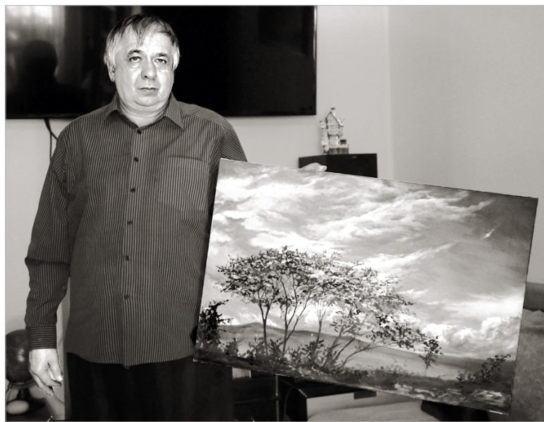
Художник Михаил Савицкий.

Михаилу выпала судьба родиться с фамилией, которая предрешила его профессиональное предназначение. Его тезка – народный художник СССР Михаил Савицкий был выдающимся белорусским живописцем. История искусств сохранила также имя действительного члена Императорской академии художеств, известного жанрового живописца XIX века Константина Савицкого.