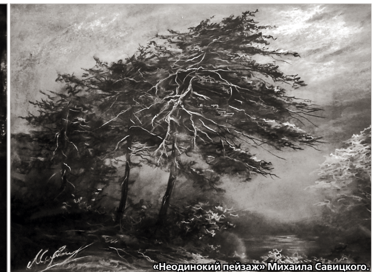
«Неодиноким пейзаж» Михаила Савицкого.