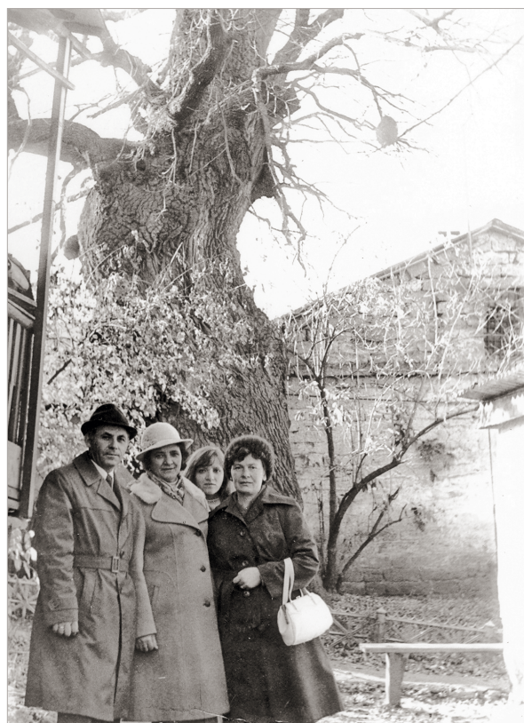
Возле «лермонтовского» дуба. 1970-е годы.

В середине 70-х годов XX века, не выдержав напора стихии, дуб рухнул. Сохранились не только его фотографии, но и срез ствола, который можно увидеть сегодня в отделе природы Ставропольского государственного музея-заповедника имени Г.Н. Прозрителева и Г.К. Пправе.