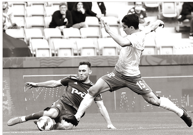
Матч «Сочи» – «Локомотив» стал украшением тура

«Локомотив» в первой части тайма с трудом выходил в атаку. Сочинцы грамотно закрывали зоны, поэтому Керк, Кухта и Изидор оказались отрезаны от остальных. Первый гол получился закономерным – сначала Гильерме потащил удар Кассьерры, но не справился с добиванием Маргасова. Дальше – новые атаки: спасал вратарь, мяч проходил рядом со штангой, но «Локо» держался. Два раза судьёй матча Василия Казарцева даже приглашали смотреть видеоповторы с потенциальными пенальти в сто-