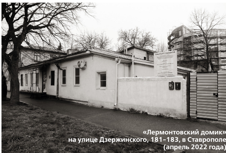
«Лермонтовский домик» на улице Дзержинского, 181-183, в Ставрополе (апрель 2022 года)

18 апреля – Международный день охраны памятников и памятных мест