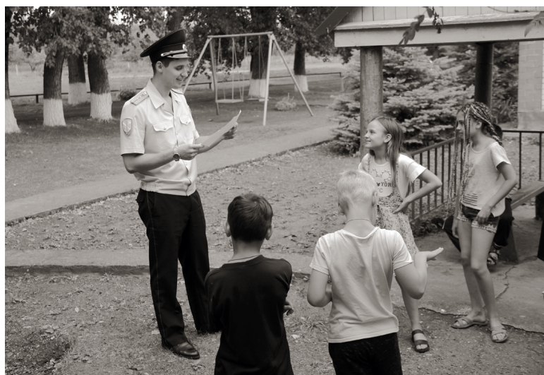
Работа с детьми