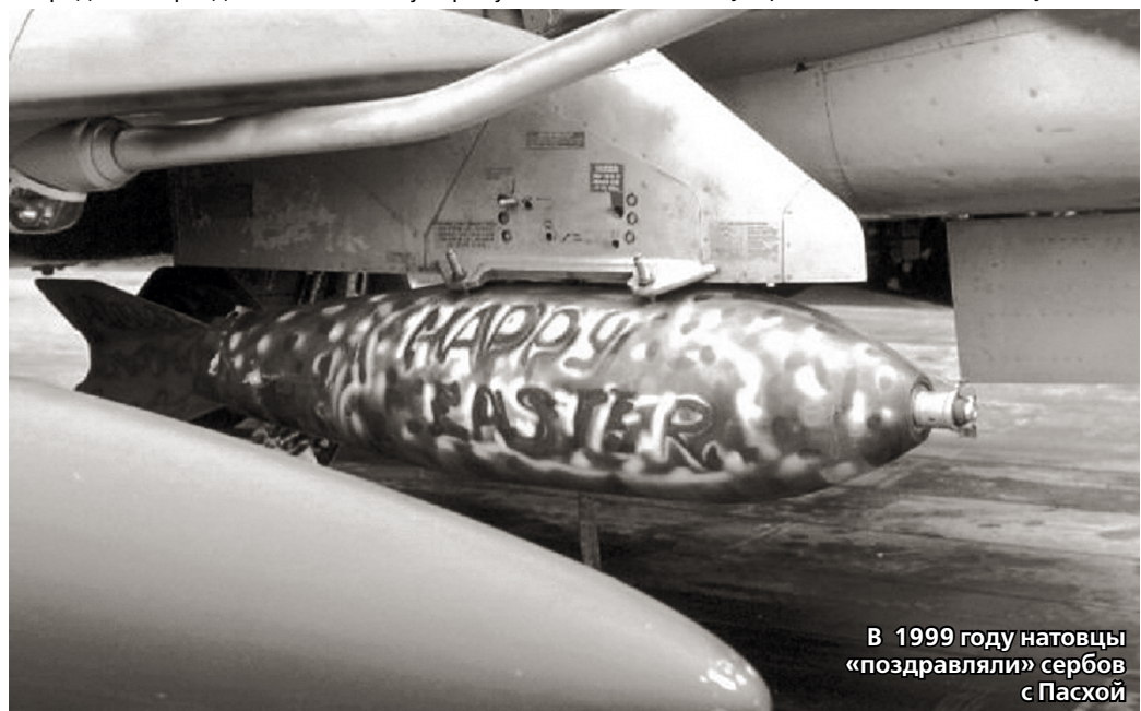
В 1999 году натовцы «поздравляли» сербов с Пасхой