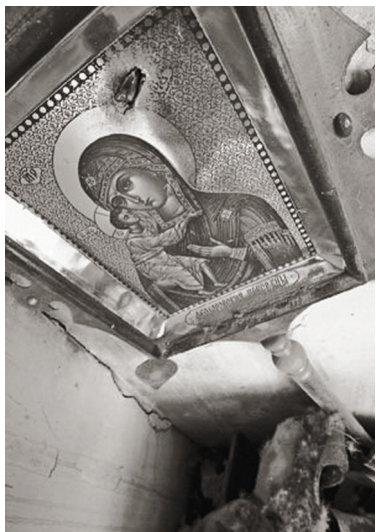
Цхинвал. Простреленная икона

По общим духовным ценностям Украины, России, Беларуси с конца 80-х просто катком катались... Украину удалось «раскатать» - в том числе (начиная с 2014-го) - и