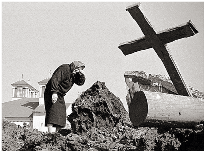
Пасха в Белграде. 1999 год