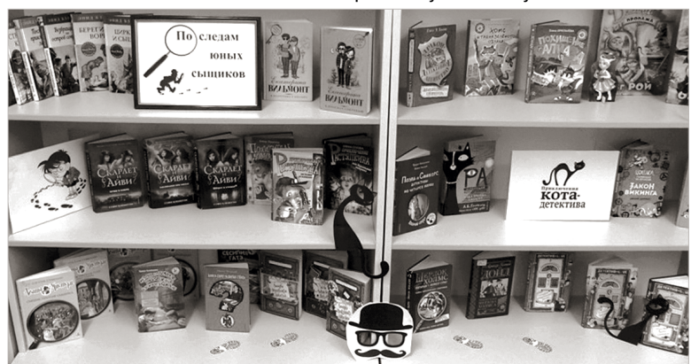
Обзор писем подготовила Лариса РАКИТЯНСКАЯ.

Для ребят, которые любят читать детективы, в детской библиотеке оформлена книжная выставка «По следам юных сыщиков». Если вы любите разгадывать загадки и сложные головоломки, познакомьтесь с детскими детективами таких серий, как «Детский детектив», «Чёрный котёнок», «Юный сыщик» и другие. В увлекательных и поучительных произведениях вы найдёте находчивых героев, весёлые приключения, таинственные истории и почувствуете себя настоящими сыщиками. Герои этих книг – дети, они учатся в школе, делают уроки, в свободное время играют в компьютерные игры, ходят на дискотеки. А еще они занимаются настоящими расследованиями: сбором улик, слежкой за подозреваемыми. Увлекательные, смешные, а порой и опасные приключения! Все юные читатели «Вечерки» получили приглашение познакомиться с выставкой и взять понравившуюся книгу.