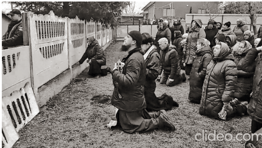
Черновицкая область. Молитвенное стояние