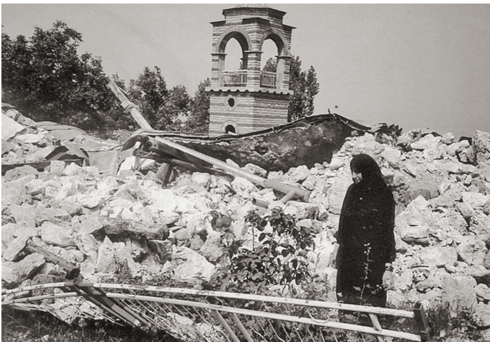
Монастырь Святой Троицы. Косово