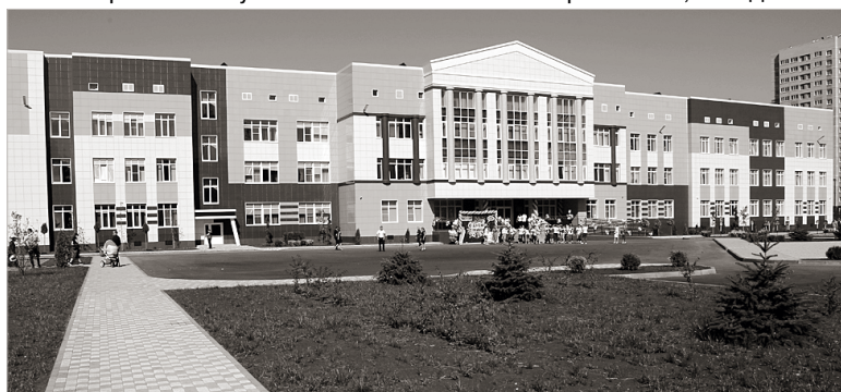
На территории Промышленного района находится 70 образовательных учреждений

Для меня, конечно, наш район – неотъемлемая частица жизни, я горжусь тем, что причастен к его развитию. Уверен, что лучшие традиции, сложившиеся за 45 лет, будут продолжаться, что новые поколения жителей района напишут свои, еще более интересные страницы нашей общей истории.