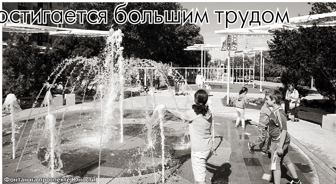
Фонтан на проспекте Юности

Администрация Промышленного района работает в тесном контакте с управляющими компаниями. Ежемесячно проводятся совещания с руководителями УК, на которых рассматриваются вопросы управления многоквартирными домами, содержания общего имущества домов, выполнение мероприятий к их сезонной эксплуатации, содержание придомовых территорий. Постоянно обсуждаются изменения в