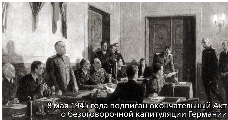
8 мая 1945 года подписан окончательный Акт о безоговорочной капитуляции Германии

06.00 Смешанные единоборства. UFC. Чарльз Оливейра против Джастина Гейджи. Прямая трансляция из США (16+) 08.00 Новости 08.05 Все на Матч! (12+) 09.35 Новости 09.40 М/с «Спорт Тоша» 09.45 М/ф «Смешарики» 10.10 Х/Ф «НЕОСПОРИМЫЙ-3. ИСКУПЛЕНИЕ» (16+) 12.10 Смешанные единоборства. UFC. Чарльз Оливейра против Джастина Гейджи. Трансляция из США (16+) 12.55 Новости 13.00 Бокс. Турнир «Знамя Победы». Прямая трансляция (16+) 15.30 Все на Матч! (12+) 15.55 Волейбол. Чемпионат России «Суперлига Paribet». Женщины. Финал. Прямая трансляция 18.00 Все на Матч! (12+) 18.25 Хоккей. Международный турнир. Финал. Прямая трансляция из Санкт-Петербурга 20.45 После Футбола с Георгием Черданцевым (12+) 21.40 Футбол. Чемпионат Италии. «Верона» – «Милан». Прямая трансляция 23.45 Все на Матч! (12+) 00.30 Футбол. Чемпионат Германии. «Бавария» – «Штутгарт» 02.20 Волейбол. Чемпионат России «Суперлига Paribet». Мужчины. «Финал 6-ти». «Зенит-Казань» – «Динамо» (Москва). Трансляция из Казани 03.45 Новости 03.50 Баскетбол. Единая лига ВТБ. 1/2 финала 05.30 Все о главном (12+)