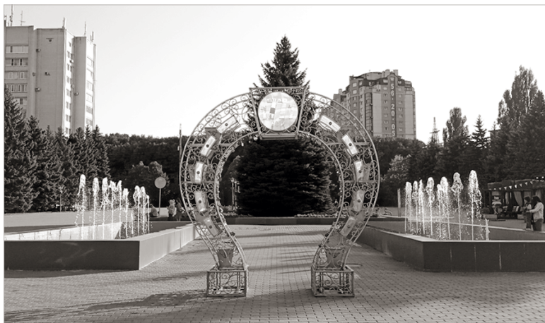
Площадь 200-летия Ставрополя

Совсем скоро еще одна – тоже на полторы тысячи учеников – от-