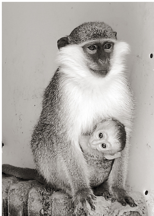
Зелёная мартышка с новорождённым детёнышем