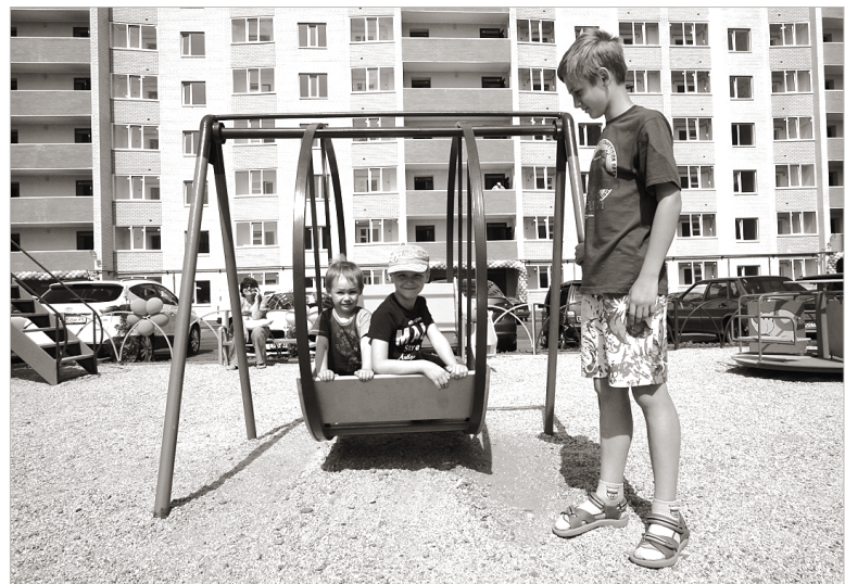
Детские и спортивные площадки – для юных ставропольцев