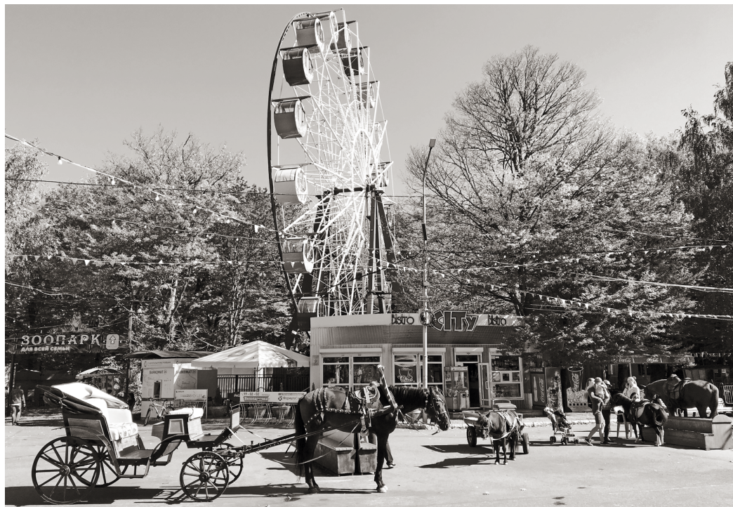
Центральная аллея парка Победы