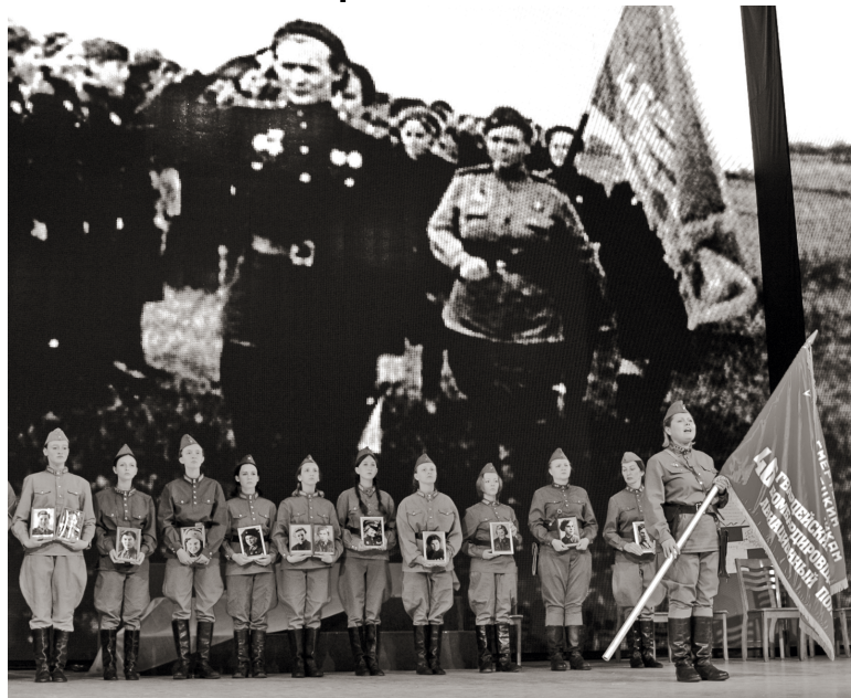
Сцена из спектакля «Ночные ведьмы» театра-студии «Слово»

Коллектив театра-студии «Слово» вышел за рамки уроков истории и создал спектакль, который основан на реальных событиях Великой Отечественной войны. Режиссер-постановщик Евгений Пересыпкин выступил одновременно как автор инсценировки, которую написал, опираясь на документальные источники и