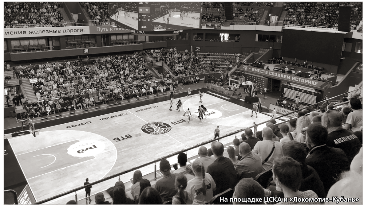
На площадке ЦСКА и «Локомотив-Кубань»