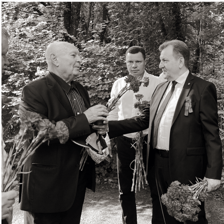
Ранним утром 22 июня на Даниловском кладбище почтили память героев