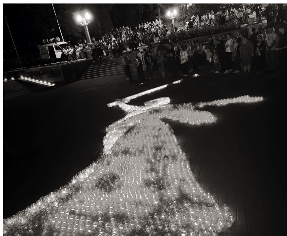
Накануне дня начала войны у Вечного огня выложили огнями символическую фигуру Родины-матери

«Мы должны помнить всегда, какой ценой было завоевано счастье жить под мирным небом. Приятно, что молодежь все больше принимает участие в таких мероприятиях. Надеюсь, вы передадите эту память и своим детям. Низкий поклон тем, кто защитил