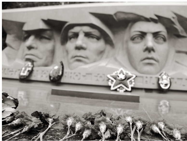
Сотни красных цветов — как напоминание о миллионах жертв войны