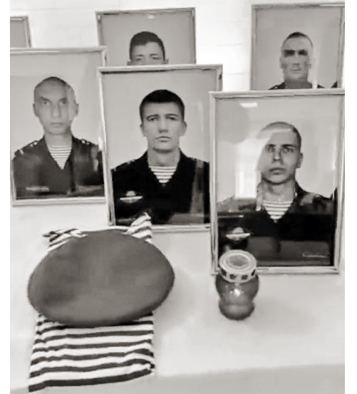
247-й десантно-штурмовой полк понес потери в первые дни спецоперации