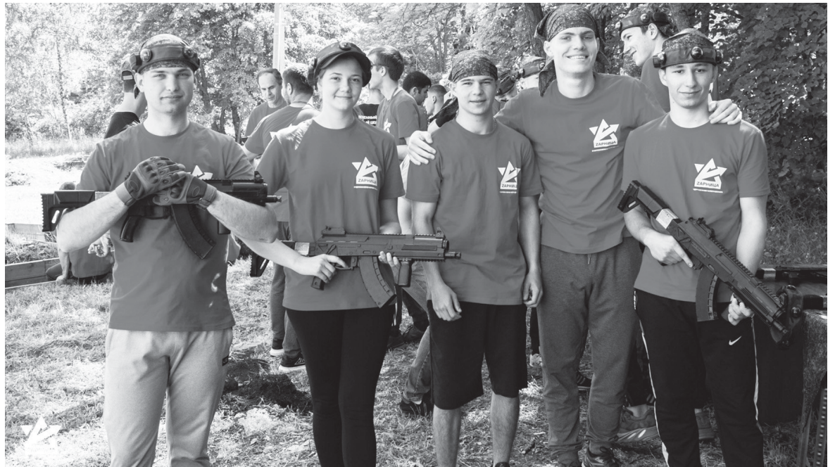
В конце мая на базе СКФУ прошёл Ставропольский региональный этап Всероссийской военно-патриотической студенческой игры «Зарница». Участвовали десять сборных команд вузов Невинномысска, Ессентуков, Буденновска и Ставрополя

- Мы не ведём учёт проведённых мероприятий в конкретных школах. Более того, школы – не совсем наша сфера. По закону мы охватываем молодежь только от 14 лет, то есть не раньше 9-го класса. Однако в общем объёме наших мероприятий принимают участие и школьники: к примеру,