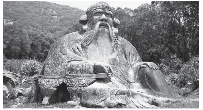
Каменная скульптура Лао Цзы, расположенная к северу от г. Цюаньчжоу, Китай

Но вот в чем загвоздка - на заболевания внутренних органов, как ни странно, у иммунной системы руки коротки. Да, она может подсобить, но не больше. Да и медицина, как оказалось, способна бороться со следствиями - до причин добраться не способна, потому как причины рождены эмоциями и психикой. Вот потому-то животные и не болеют, у них нет такой воз-