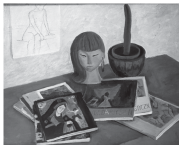
Валерия Чемсо. «Натюрморт с кактусом» (1972)

В Ставропольском краевом музее изобразительных искусств открылась восьмая выставка проекта «Фестиваль мемориальных коллекций художников Ставрополья. Гильдия мастеров. Достояние». Она посвящена работам художников, переживших тяготы военных лет в детском возрасте, и называется – «Испытание чувств. Дети войны».