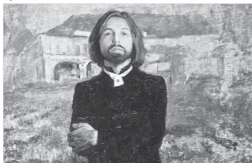
Никас Сафронов. «Автопортрет на фоне...»

В минувшую пятницу состоялось открытие выставочного проекта «Мистерия» известного советского и российского художника, члена Российской Академии художеств заслуженного художника РФ Никаса Сафронова. В 2021 году ему было присвоено звание народного художника России.