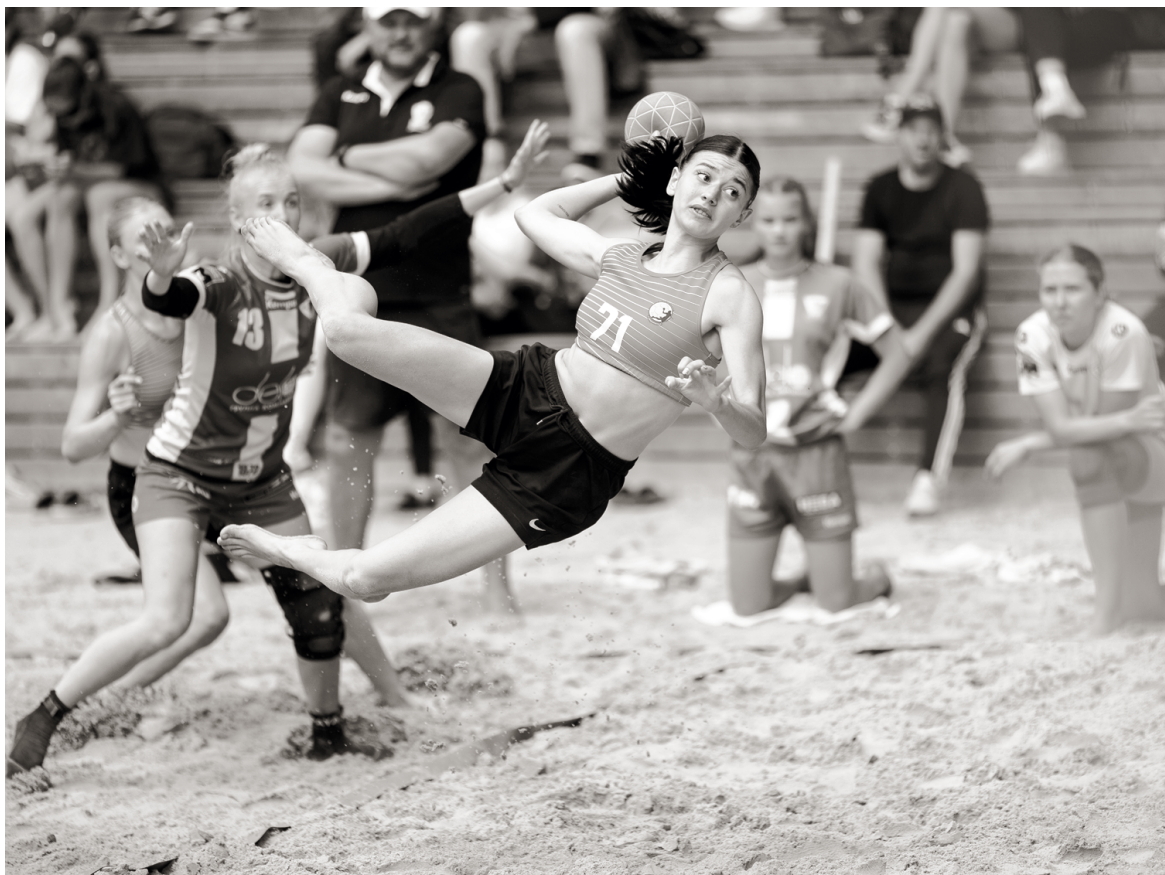
Опасный момент... гол!

Во второй игровой день оставалось сыграть два матча. Сначала свою встречу проводили команда «Ровесник» и сборная Краснодарского края. Девушкам из Крымска отступать было некуда. Проиграв эту встречу, они лишились всех шансов на бронзовые медали. Собрав всю волю в кулак, переломив неудачные моменты, они смогли по буллитам оставить себя в гонке за призы. Последними на песок в минувшую субботу вышли «Ставрополье» и Щербиновский район. Победив в этой игре, наши девушки досрочно обеспечили себе золотые медали. Однако было одно «но». Именно щербиновки нанесли нашим девушкам единственное поражение на турнире. И тут еще начался дождь, который перерос в непродолжительный ливень. Но, как известно, хорошие мастера сыграют в лю-