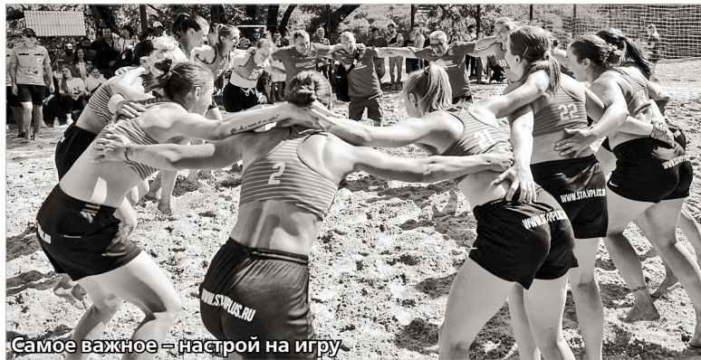
Самое важное – настрой на игру

«джокером», вратарем или после 6-метрового штрафного броска. Да, в «пляжке» есть джокер. Это полевой игрок, который выходит в атаку вместо вратаря. Встреча на песке длится 2 сета по 10 минут. Каждая партия начинается со счета 0:0. Если по итогам сета не удалось выявить сильнейшего, играют до первого заброшенного мяча, то есть «золотого гола». Ничья же по итогам двух проведенных отрезков означает серию буллитов по 5 бросков от каждой команды. Удаляется игрок в пляжном гандболе на одно владение, то есть в среднем на 10-15 секунд.