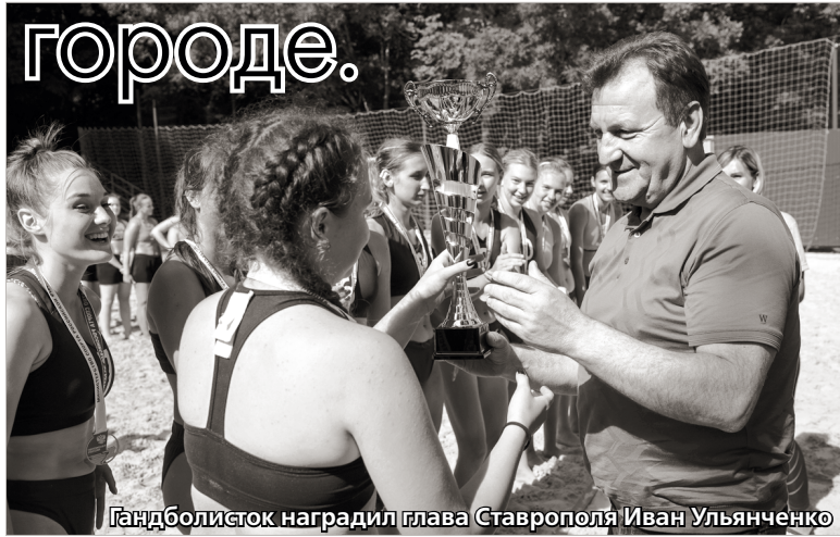
Гандболистка наградила глава Ставрополя Иван Ульянченко