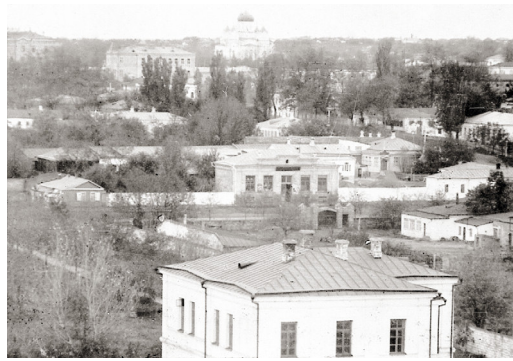
Вид с колокольни Андреевской церкви