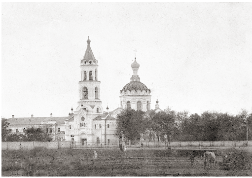
Андреевская церковь города Ставрополя