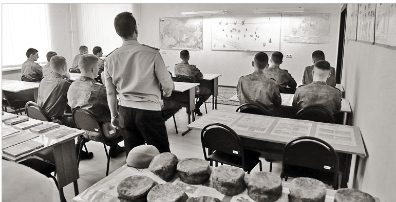
Идет практическое занятие по действиям тревожной группы