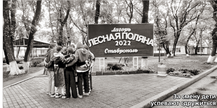
За смену дети успевают сдружиться

Каждый день в лагере насыщен: сразу после подъема в 8 утра дети заправляют постели (кое-кто, кстати, научился делать это именно здесь) и отправляются на зарядку. А затем каждое утро на линейке торжественно поднимают флаг России. Это большая честь, она предоставляется тому ребёнку, который особенно отличился в предыдущие дни. После завтрака дети разбегаются заниматься в различных кружках по интересам, где проводят время до обеда, а затем, после еды – дневной сон.