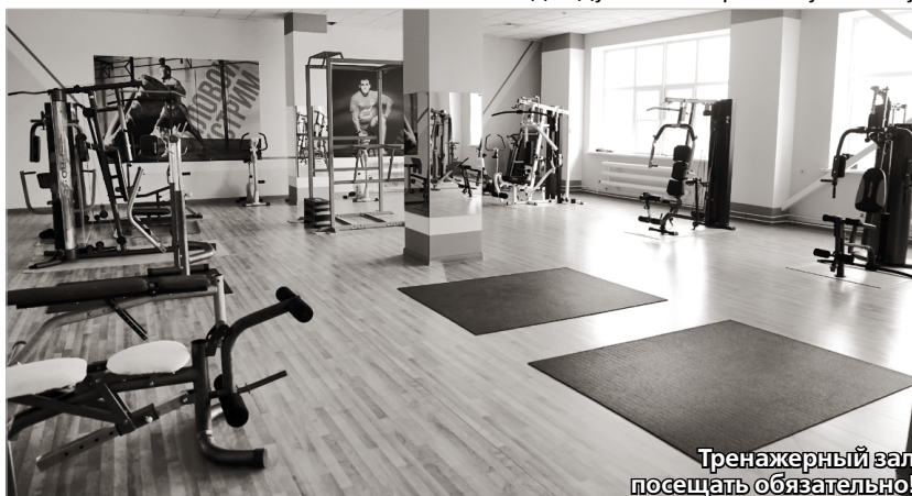
Тренажерный зал посещать обязательно!