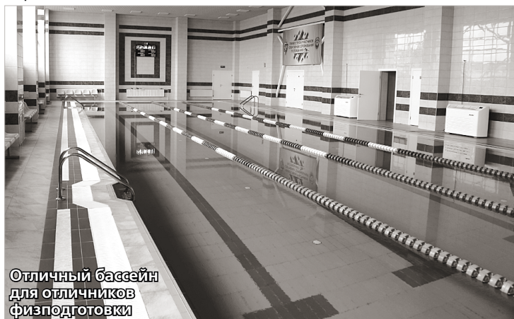
Отличный бассейн для отличников физподготовки