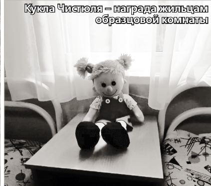
Кукла Чистюля – награда жильцам образцовой комнаты

Насыщенный ритм жизни в лагере заставляет даже подростков отдыхать днем, чтобы набраться сил ко второй половине дня. А там их ждут всевозможные общелагерные мероприятия. Как только стемнеет, все дружно смотрят фильмы в беседке на свежем воздухе или танцуют под музыку в сопровождении диджея.