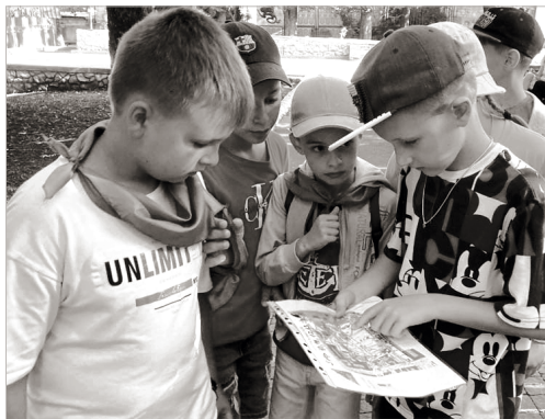
Более шестисот детей за лето посетили «Веселый улей»

Идеальное место для множества интересных занятий в Ставрополе – лагерь «Веселый улей». За более чем 30 лет у этого прекрасного места сложилась система работы по организации отдыха, оздоровления и занятости детей во время школьных каникул. Накопленный во Дворце опыт, имеющиеся традиции, кадровый потенциал позволяют ДДТ постоянно совершенствовать эту работу. Разнообразие подходов к жизнедеятельности детей в лагере дает возможность вводить новые программы, реализация которых гарантирует отдых, укрепление здоровья детей и под-