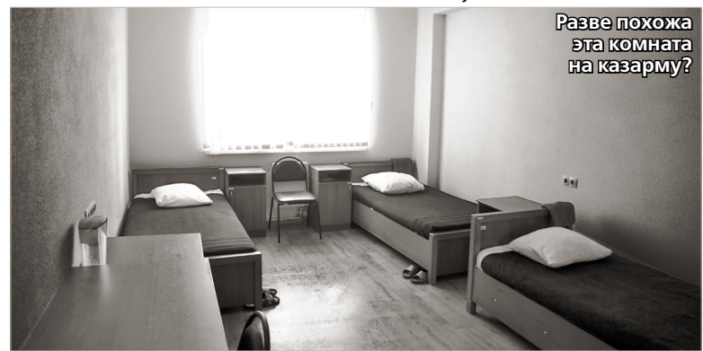
Разве похожа эта комната на казарму?