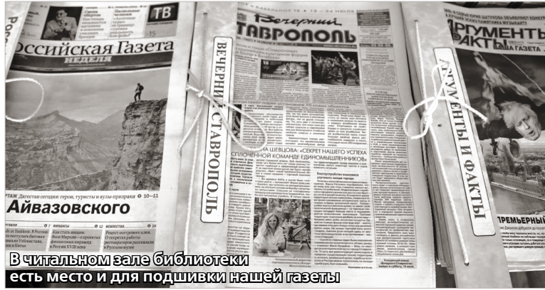
В читальном зале библиотеки есть место и для подшивки нашей газеты

Говорящий факт: за 15 лет за неуспеваемость отчислен (получил справку) только один человек. В стенах филиала ничего не слышали и о таком понятии, как «неподобающее поведение». Один из сотрудников так и сказал мне: да курсантам просто некогда дурака валять!