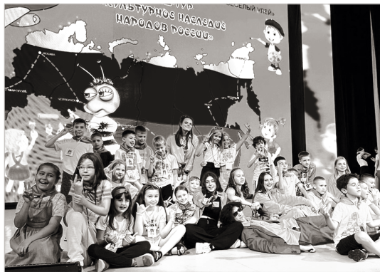
Школьники с удовольствием организуют фестивали, концерты и различные шоу

В этом году лагерь за три смены принял бо-