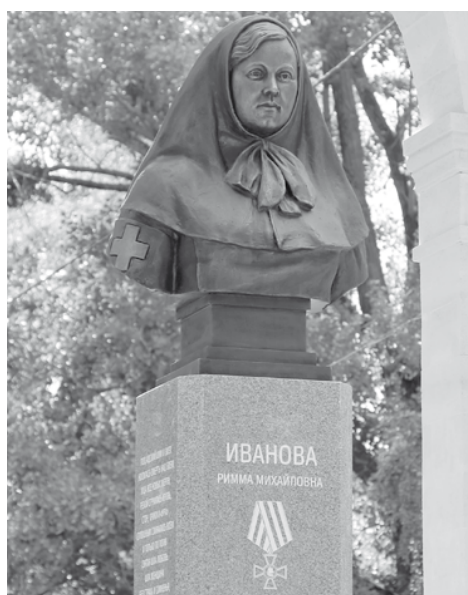
Памятник Римме Ивановой

9 сентября 1915 года у деревни Мокрая Дуброва, находящейся ныне в Пинском районе Брестской области Республики Беларусь, уже награжденная к тому времени Георгиевским крестом 4-й степени и двумя Георгиевскими медалями Римма Иванова, как обычно, помогала раненым в бою. Когда