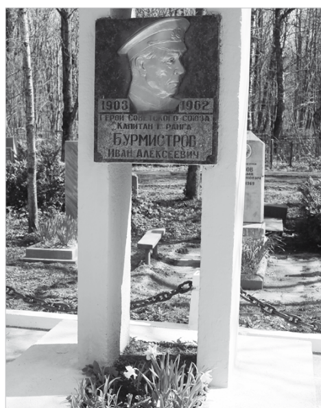
Иван Бурмистров похоронен на Даниловском кладбище Ставрополя

Последний бой младшего лейтенанта госбезопасности Ивана Гурьяновича Булкина состоялся в Ставрополе при его освобождении. 19 января 1943 года 347-я стрелковая дивизия подошла к краевому центру, после чего немцы решили сжечь город, и начали осуществлять свой замысел. Ночью 20 января советская разведгруппа, которую возглавлял Иван Булкин, проникла в Ставрополь. Солдаты вышли в район железнодорожного вокзала и разбили на группы.