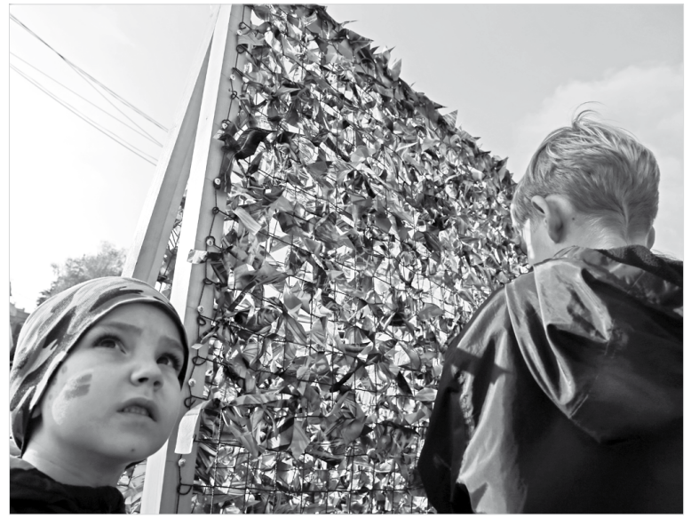
Все жители края включаются в помощь фронту

Также губернатор отметил, что ведутся переговоры о приобретении готового здания под еще одну поликлинику, но там собственник заломил цену в три раза выше рыночной. Есть, конечно, надежда, что с вводом в строй новой поликлиники собственник поймет, что в его здании город нуждается уже не столь критично, и умерит аппетиты... Ну а пока министру здравоохранения поручено провести организационную работу в поликлинике Михайловска, пересмотреть штатное расписание и принцип распределения талонов к врачам в медучреждении.