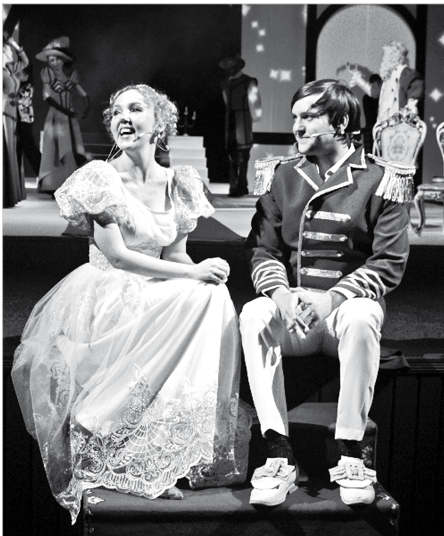
ТЕАТР ДРАМЫ им. М.Ю. ЛЕРМОНТОВА 30 декабря Премьера Е. ШВАРЦ «ЗОЛУШКА» (0+) Начало в 10.00 и 13.00 Сказка

04.55 КОМЕДИЯ «ДОЯРКА ИЗ ХАЦАПЕТОВКИ» (12+) 08.00 «Вести». Местное время 08.20 Местное время. Суббота 08.35 «По секрету всему свету» 09.00 «Формула еды» (12+) 09.25 «Пятеро на одного» 10.10 «Сто к одному» 11.00 «Вести» 11.45 «Парад юмора. С наступающим!» (16+) 13.50 КОМЕДИЯ «ОПЕРАЦИЯ «Ы» И ДРУГИЕ ПРИКЛЮЧЕНИЯ ШУРИКА»