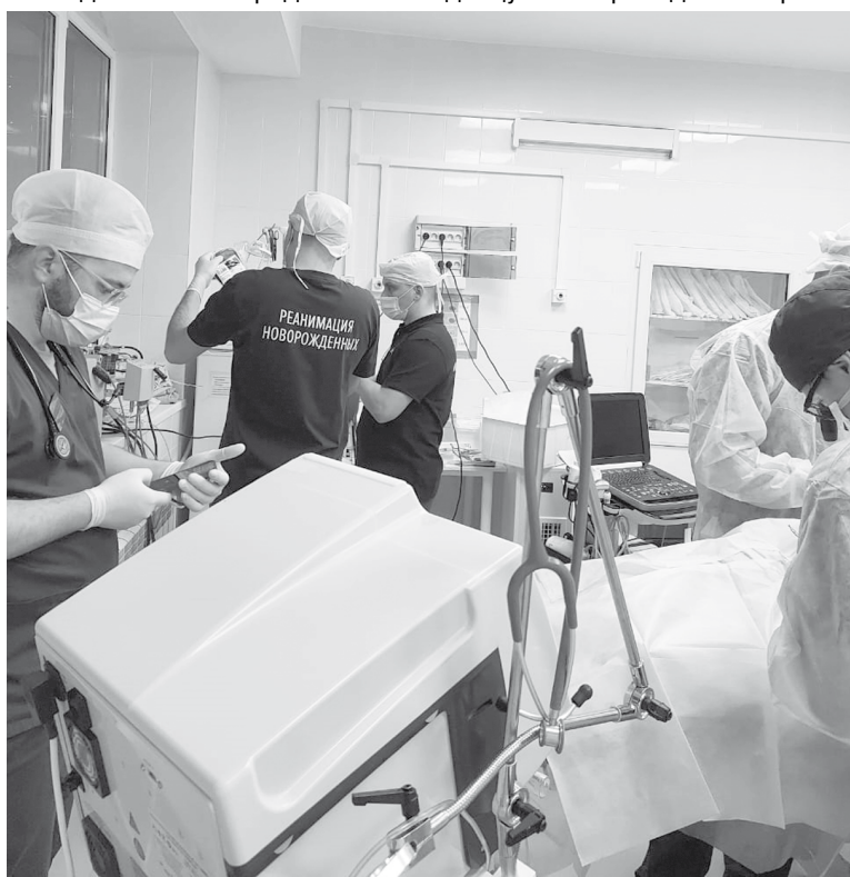
Врачи из Санкт-Петербурга спасают жизнь ребенку

Пассажиры могут также воспользоваться электронными сервисами. После посещения клиентской службы Социального фонда информация о льготнике автоматически поступает в транспортную компанию, и человек получает возможность оформить бесплатный проездной документ через Интернет.