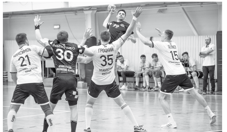
«Виктор» в защите

Второй тайм можно показывать молодым гандболистам в качестве видеопособия по «игре на классе». «Викторианцы» спокойно и мето-